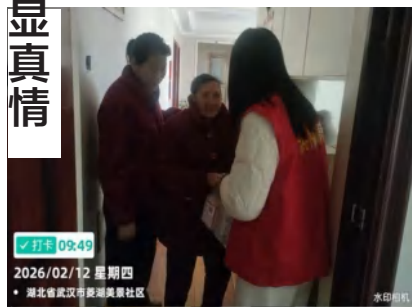
菱湖美景社区：寒冬送温暖 慰问显真情

菱湖美景社区老年人服务中心开展“情暖冬日·爱满菱湖”春节走访慰问活动，为社区内35户高龄、独居及困难老人送去关怀。活动前期，工作人员以电话上门等方式精准摸排，精心准备了内含面条、纸巾、刀具等实用物资的“暖心福袋”。在老龄老人家中，工作人员仔细叮嘱老人注意冬季防寒保暖，按时服药，保持乐观心态，并提醒注意防火防电防诈骗。一句句问候，一声声叮嘱，一次次握手，让老人们真切感受到了大家庭的温暖。